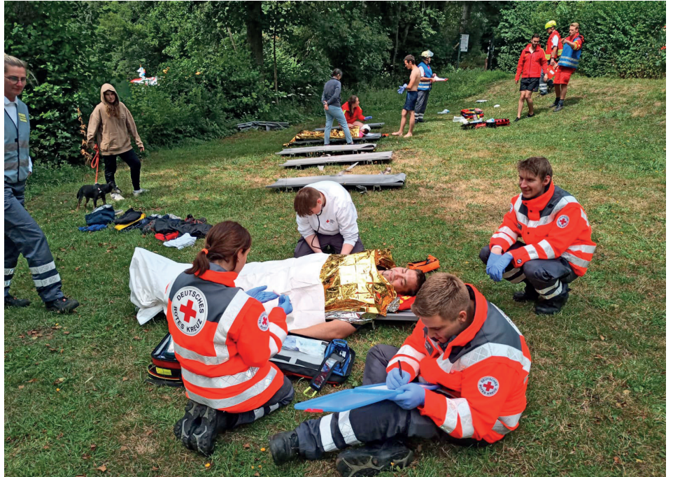
Bei regelmäßigen Übungen wird das erlernte Wissen praxisnah umgesetzt und vertieft.

„Mittendrin statt nur dabei“: Sanitätsdienst bedeutet nicht Warten, sondern aktives Miterleben - nah an den Menschen, nah am Geschehen. Ob beim Maare-Mosel-Lauf, beim Vulkanbike, beim Klassiker auf dem Vulkan oder wenn es bei „Der Detze rockt“ laut wird – der OV Daun ist dabei, dieses Jahr sogar bei Rock am Ring. Für die Sanitätsdienste ist der DRK-Ortsverein Daun mit MTW, KTW, RTW und ATV gut aufgestellt – das All-Terrain-Vehicle kam auch direkt beim Rock am Ring zum Einsatz. Außerdem werden die Blutspendetermine in der Region unterstützt. Seit Januar 2026 gibt es in Daun auch wieder ein Jugendrotkreuz, das die Jüngsten begeistert und heute schon die Grundlage für das Ehrenamt von morgen legt.