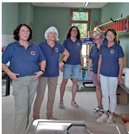
Die fleißigen Helferinnen sorgen für die Verpflegung während der Blutspende.

Beim DRK-Ortsverein Kelberg lagen zunächst die Aufgabenschwerpunkte im Sanitätsdienst bei Veranstaltungen am Nürburgring und der Absicherung von Sportveranstaltungen. Heute kümmert sich der OV hauptsächlich um die Blutspendetermine in Kelberg und Bodenbach – das sind meist sieben Termine im Jahr. Als Anerkennung der Vielfachspender wird für diese alle zwei Jahre ein Grillnachmittag veranstaltet. Darüber hinaus engagiert sich der OV bei der Bewirtung bei Seniorenveranstaltungen sowie beim Kuchenstand anlässlich des