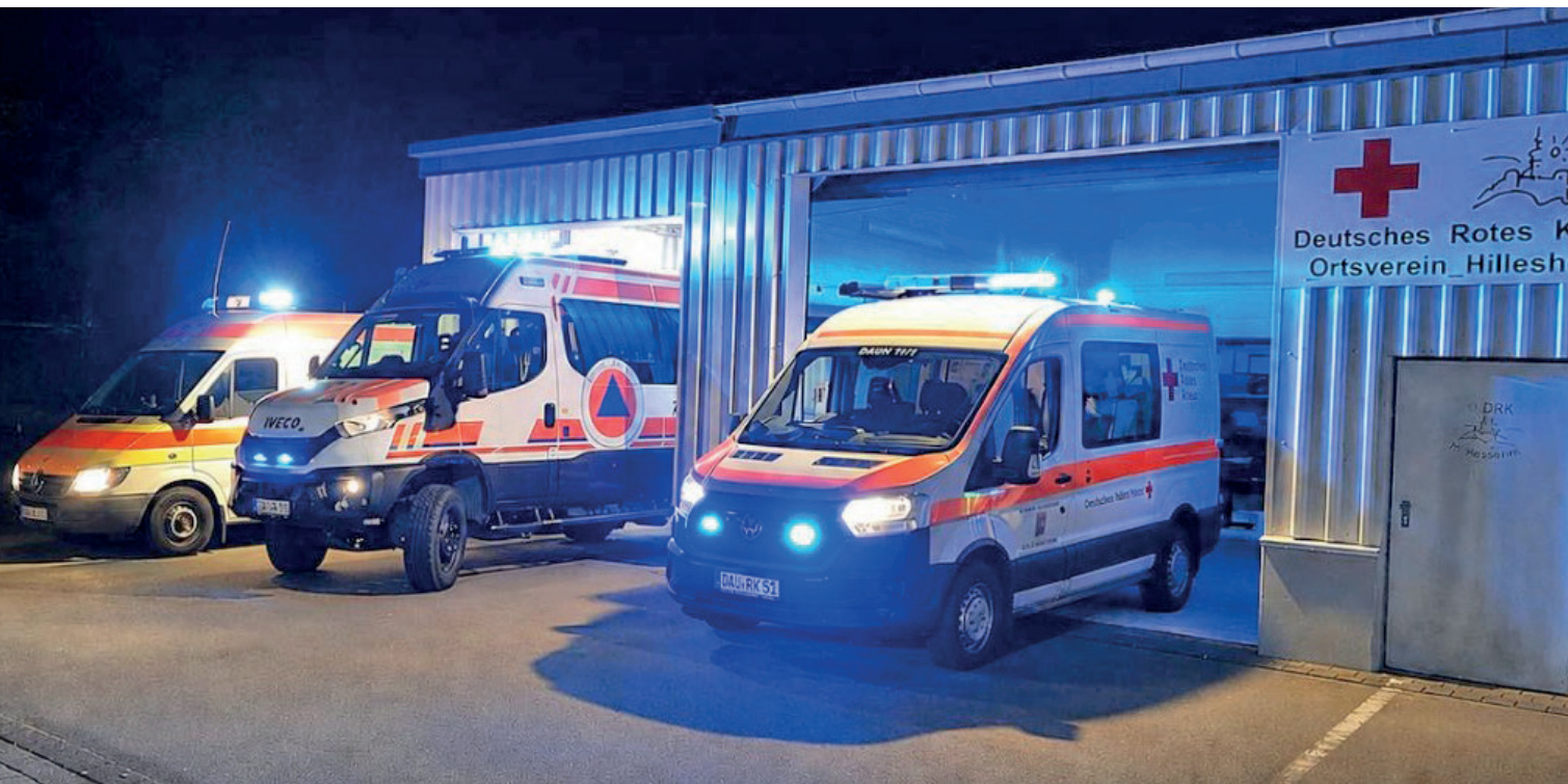
Beim DRK-Ortsverein Hillesheim ist u.a. auch der ELW (Einsatzleitwagen) des Landkreises stationiert.