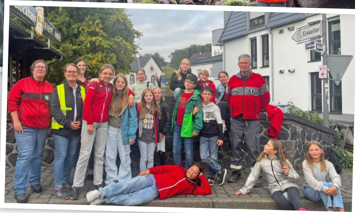
JRK-Gruppe an der Brücke in Hillesheim.