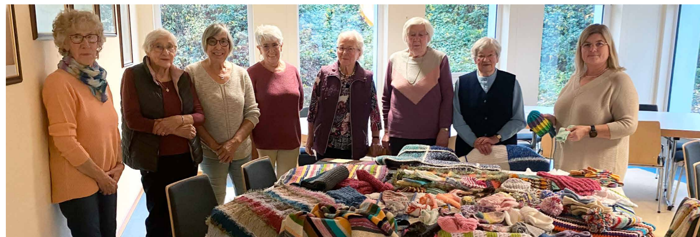
Die „Strickfrauen“ von Büscheich stricken für einen guten Zweck.

Spenden machten die Realisierung möglich: Bereits im September 2023 konnte der neue Verpflegungsanhänger inkl. aller Prüfungen und Hygienerichtlinien beim Hersteller abgeholt werden. Durch großzügige Spenden der Verbandsgemeinde Gerolstein, der Lepper Bürgerdienst Stiftung sowie Unterstützung des DRK Kreisverband Vulkaneifel e.V. wurde so ein einzigartiges Bauteil zur effizienten Verpflegung der SEG des Landkreises sowie dem Verpflegungszug des DRK-Ortsverein Gerolstein hinzugefügt.