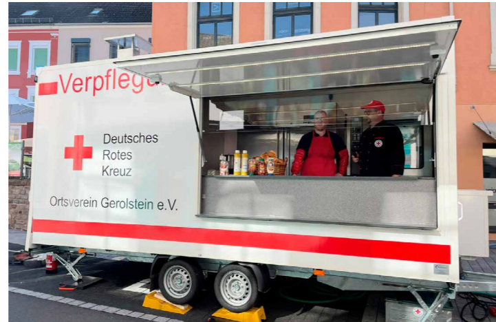
Im Verpflegungseinsatz alles dabei!

Nach Projektierung und Angebotsphase wurde im März 2023 der Auftrag an die Firma ‚Hofmann mobile Verkaufssysteme‘ in Betzdorf erteilt. Die im Ortsverein vorhandenen Kücheneinbaugeräte konnten dabei im Anhänger integriert und angeschlossen werden. Das alles ist im Einsatzfall innerhalb kürzester Zeit durch einen PKW zum Schadensort verlegbar: Industrie-Spülmaschine, Handwaschbecken mit Warmwasser und Hygienepaket, Gastro-Kühlschrank mit 1400 Liter Kühlvolumen, Gastro-Konvektomat, zwei Hockerkocher, Bräter, Doppelfritteuse und eine geräumige wettergeschützte und beleuchtete Ausgabetheke,